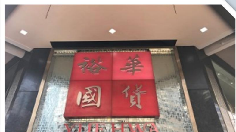
香港庶民に親しまれる老舗デパート。 食品や漢方薬なども豊富に揃っており、香港の工芸品、刺繍品も御座います。お値段もリーズナブル！ ・裕華國貨