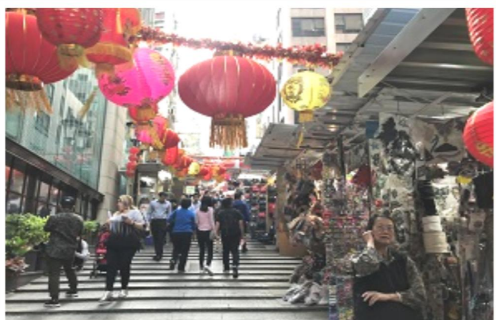
ポットインガーストリートは、やや急な坂道になっており、歴史的な雰囲気を感じることができます。イギリスの名残もあり、写真映える景色。 ・ポットインガーストリート