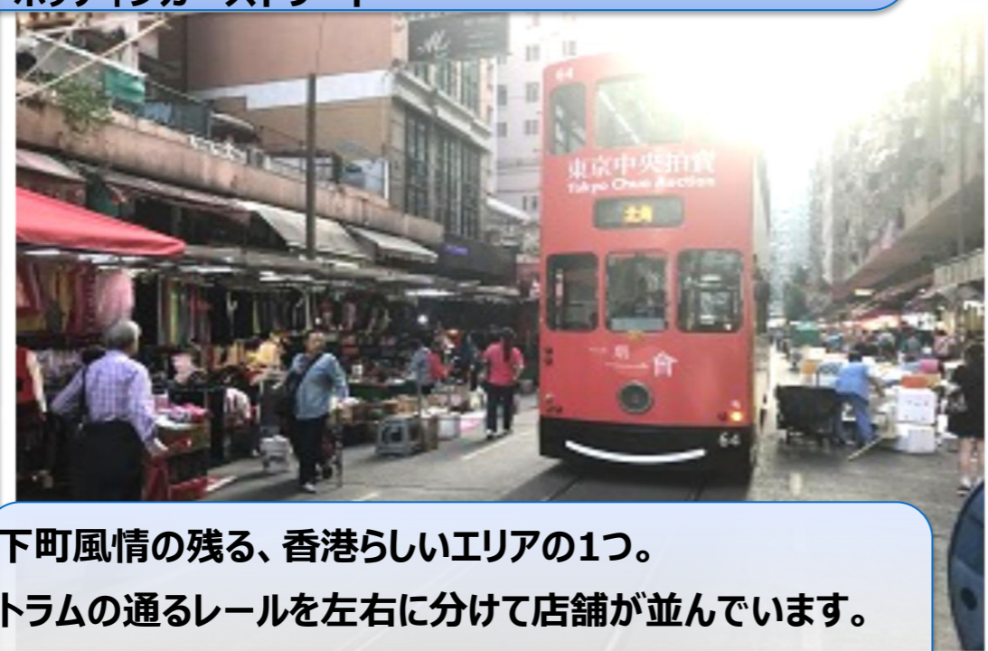
下町風情の残る、香港らしいエリアの1つ。 トラムの通るレールを左右に分けて店舗が並んでいます。 ・春秧街(チョンヨンガイ)