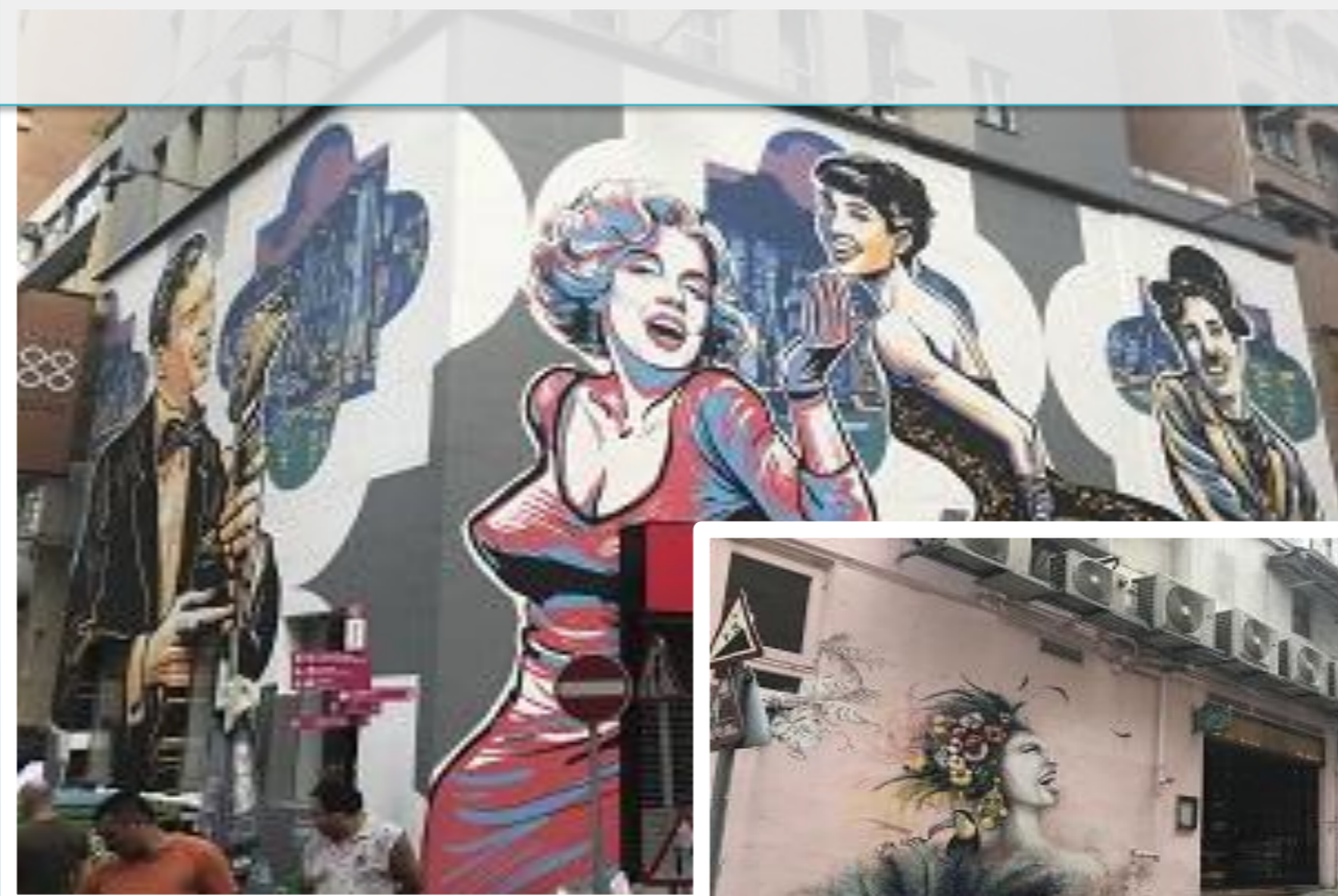
香港の絶景スポットと言えば、「ビクトリアピーク」や「レーザーショー」ですが、ハリウッドロードのアートはいま世界中から注目を浴びるフォトジェニックスポットとなっております。 ・ハリウッドロード